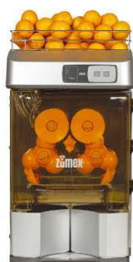
Zumex Versatile Silver