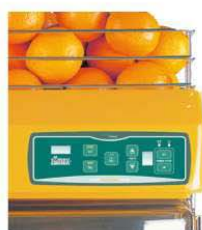
Détail Zumex Versatile D